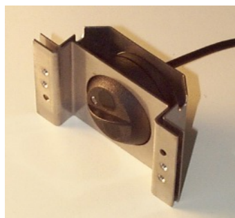
マウンティングキット パーツ No. 102 483