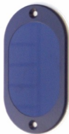
楕円形カバー パーツ No. 101 939