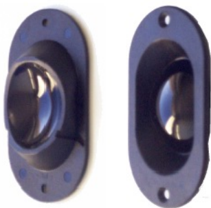
楕円形カバー パーツ No. 102 387