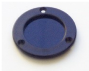
円形カバー パーツ No. 101 930 パーツ No. 102 271