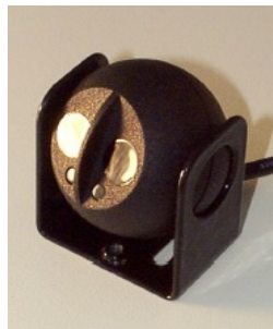
マウンティングユニット パーツ No. 101 675